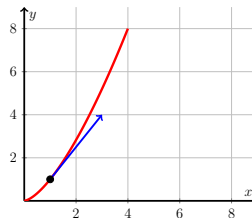
Figura 1.5: Ilustração da trajetória da partícula do Exemplo 1.5.7.

Em particular, temos que \vec{g}(0) = 0 . A trajetória da partícula é ilustrada na Figura 1.5.